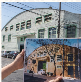
Prédios das Obras Sociais antes e atualmente

Bênção e inauguração do novo templo dedicado a São Judas Tadeu