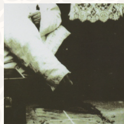
Lançamento da pedra fundamental

Lançamento da pedra fundamental do novo templo