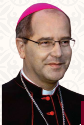
Dom Walmor Oliveira de Azevedo

Arcebispo metropolitano de Belo Horizonte