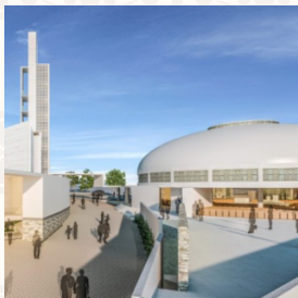
Projeto de revitalização do Santuário

Inauguração da Comunidade Santa Rosa de Lima