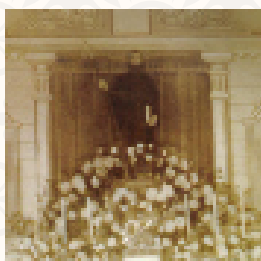
Imagem de São Judas Tadeu na primitiva capela