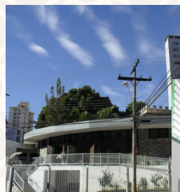
A Comunidade está localizada à Rua Jaguaribe, 1036 - Nova Floresta

Inauguração do Centro de Evangelização e Obras Sociais São Judas Tadeu na Rua Itaquera, 1166 - Bairro da Graça