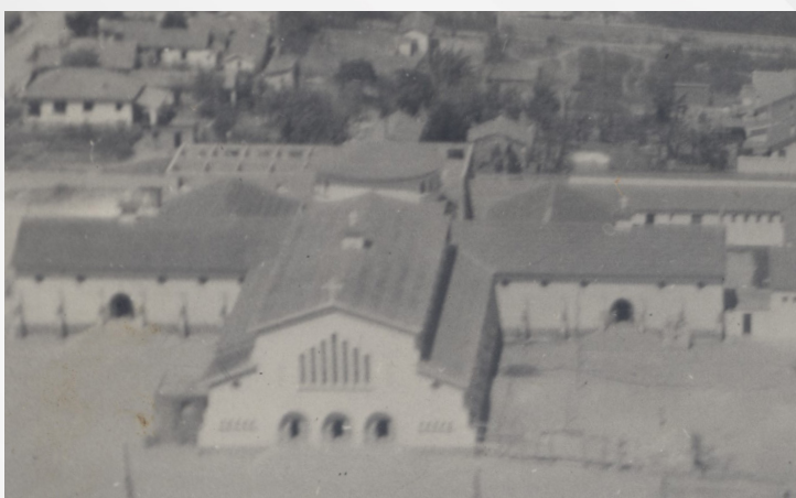
..tomou forma com a coragem e fé dos primeiros devotos...