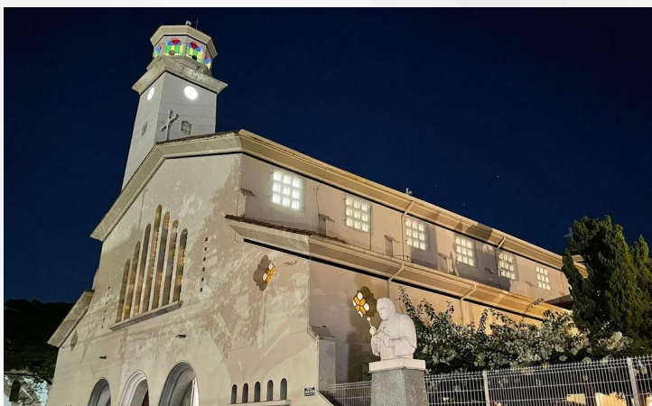
...e agora, segue sendo construído com a ajuda de cada devoto do nosso Santuário!

“Com o vosso auxílio e constante lembrança, assim nos ajudareis, quem pode muito com muito, quem pode pouco com pouco. Caros Irmãos, esta é a nossa principal e melhor realização. Fazer na terra uma casa para Deus e Deus, um dia, mais cedo ou mais tarde, como é tão cedo ou mais tarde, como é tão certo que morremos, conforme nossas obras e diligências terá preparada para nós uma casa no Céu!”