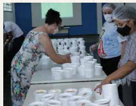
O apoio dos voluntários foi fundamental para o nosso Arraial.