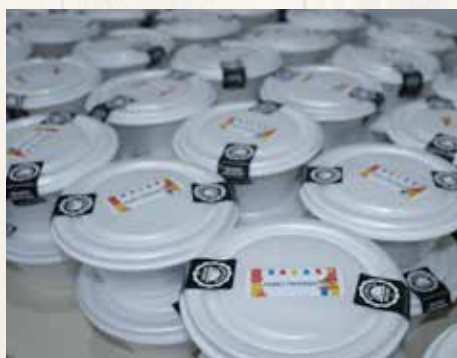
Para cada combo foram preparadas deliciosas comidas típicas.