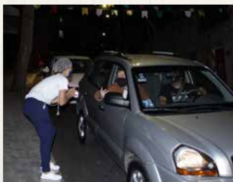
Neste ano, o Arraial foi adaptado ao formato Drive Thru.