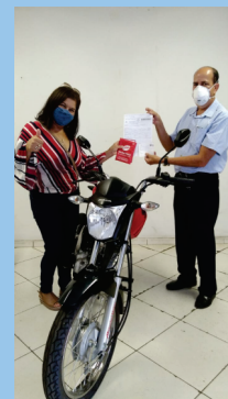
Realização do sorteio da moto da Campanha do Piso