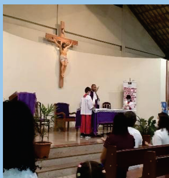
Missa em ação de graças Centenário Arquidiocese BH