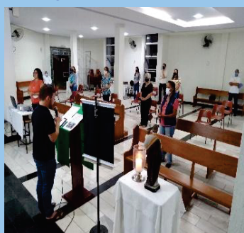
Encontros da CFE 2021