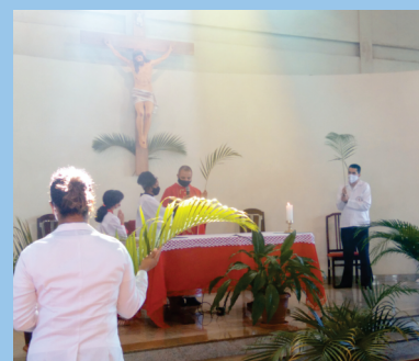
Missa de Ramos