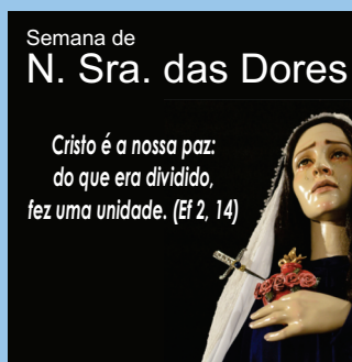
Semana das Dores em família (online)