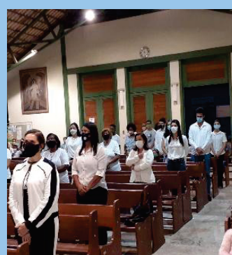
Apresentação dos candidatos a MECE