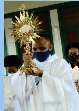
Celebração do Tríduo Pascal e Domingo da Ressurreição nas Comunidades