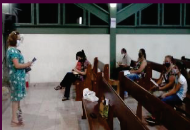
Novena de Natal Online e presencial nas Comunidades