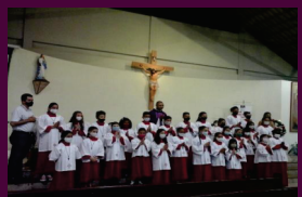
Instituição de novos Coroinhas e Cerimoniários