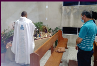
Missas de Natal e Ano Novo