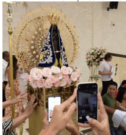
40ª Missa de N. Sra. Aparecida