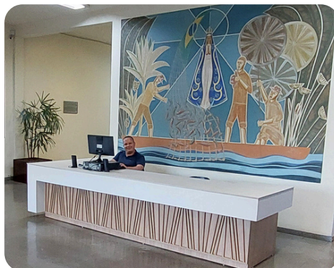
Cúria da RENSA funciona de segunda a sexta, de 9h às 18h

Espaço de acolhida, a sede da Cúria e do Centro Pastoral da RENSA é o local onde o Bispo Auxiliar e o Vigário Episcopal fazem os atendimentos. O prédio também é utilizado por pastorais e movimentos para reuniões, retiros e encontros de formação. Além disso, no local a equipe de trabalho da RENSA presta atendimentos administrativos, cartoriais e pastorais diariamente.