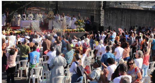
48ª Missa do Trabalhador e da Trabalhadora, em honra a São José