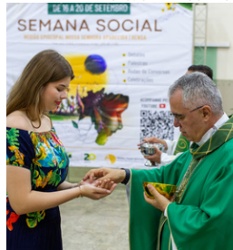
4ª Semana Social RNSA