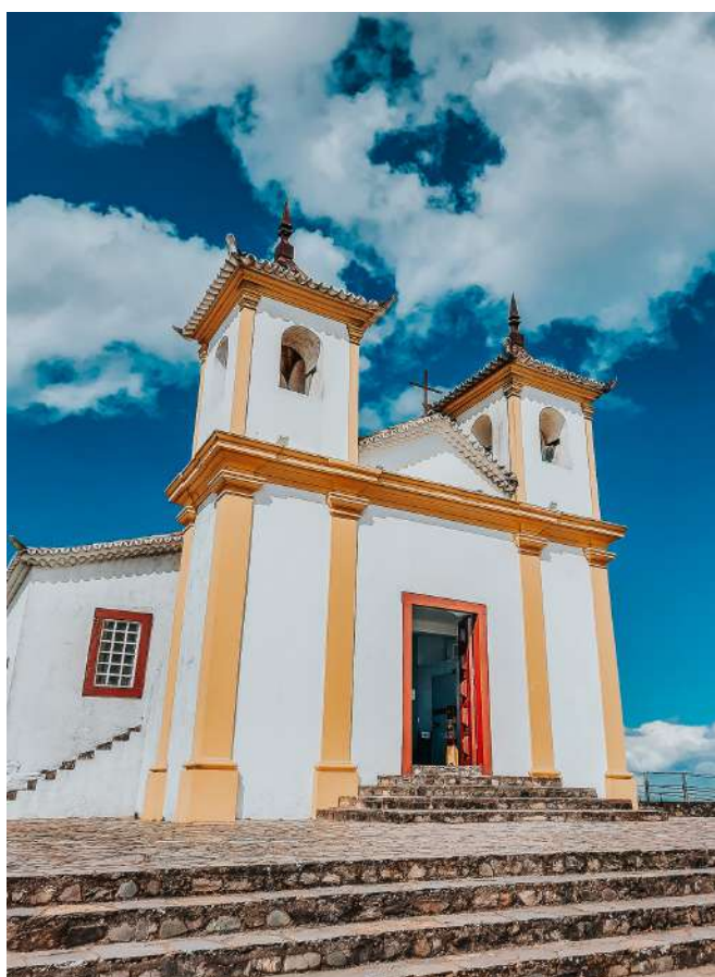
Menor Basílica DO MUNDO

Nesse lugar de sublime beleza, vale registrar cada momento. Tenha sempre em mãos uma câmera fotográfica.